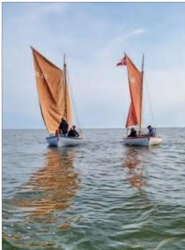
Det er et flot syn, når smækkerne sejler på Ringkøbing Fjord.

De næste syv joller var klar til søsætning pinselørdag 1994, men endnu flere havde lyst til at bygge en jolle, så et tredje byggehold begyndte på fire smækker, som blev søsat pinselørdag 1998.