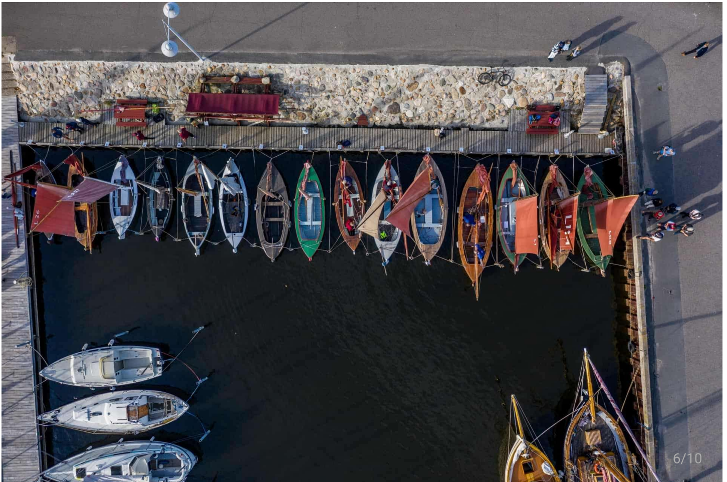
30 både var meldt til årets udgave af VM. Lidt mere end halvdelen af de deltagende både kommer fra Hjarbæk. To både kom fra Norge.